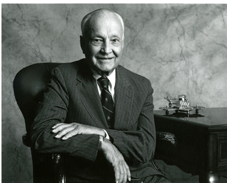
เซอร์ จอห์น เทมเปิลตัน (Sir. John Templeton)

“ตลาดกระทิง เกิดในความสิ้นหวัง โตท่ามกลางความสงสัย สุกอมยาม ทุกคนเบื่อบาน และจบลงยามทุกคน เคลิบเคลิ้ม”